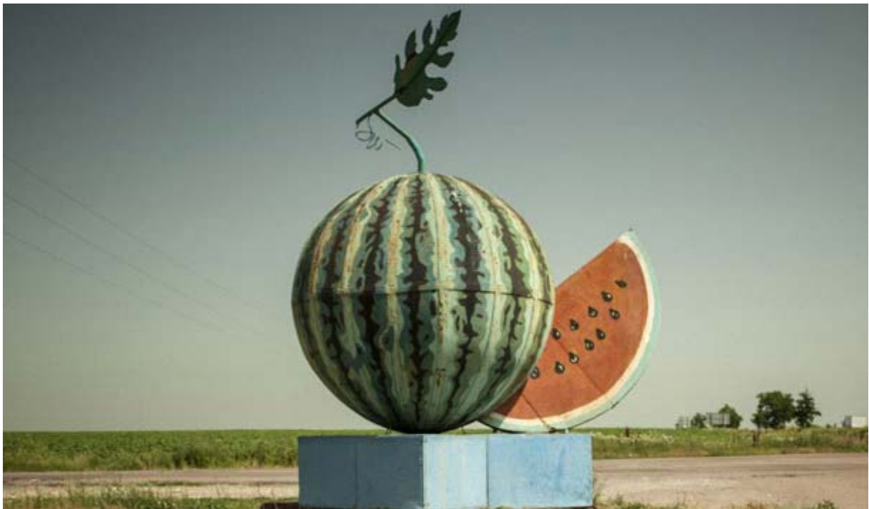
Вулкані. Volcano, UKR, DE 2018, Roman Bondarchuk

Einladung zum Pressegespräch am 2. Juni 2022